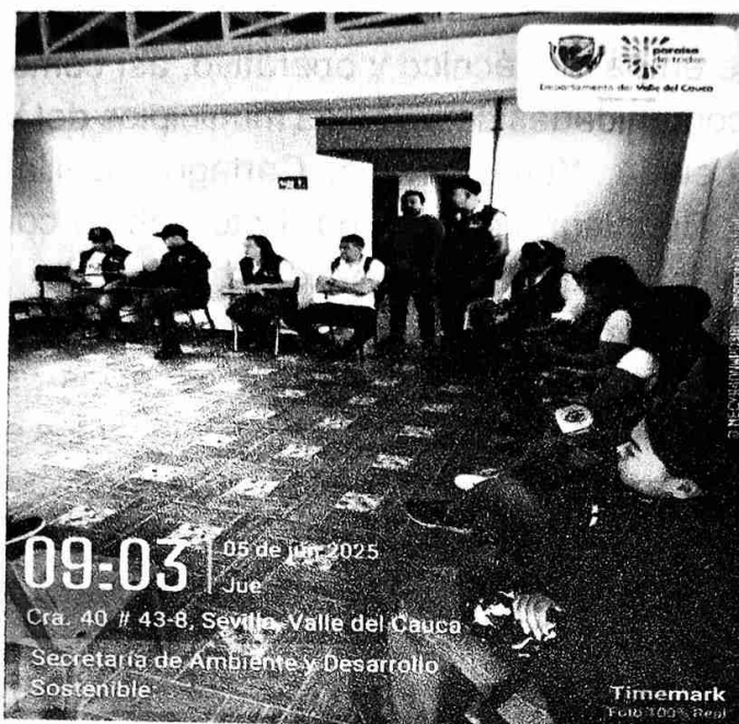
(Coordinación Equipo, jornada de siembra Municipio de Sevilla)

ampliar la cobertura arbórea urbana y rural. Además, se llevó a cabo el seguimiento inicial de la sobrevivencia de las plántulas y se socializaron lineamientos básicos para su mantenimiento y protección a mediano y largo plazo.