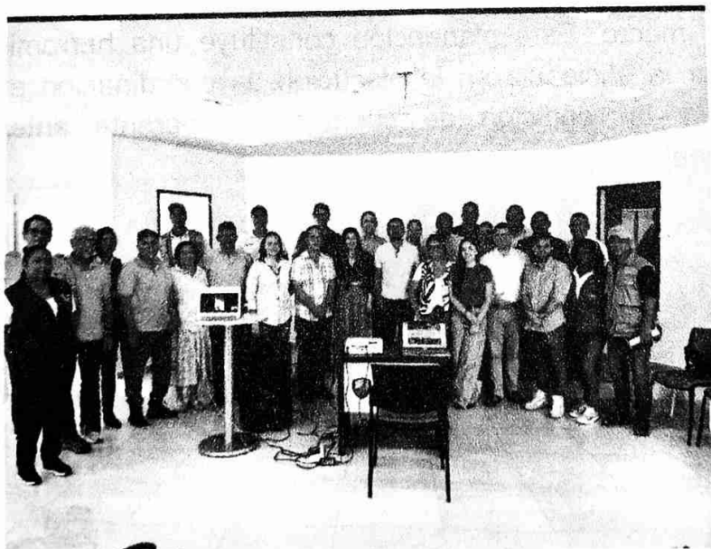
(Presentación de Proyecto de Bosques Urbanos a Comunidades)